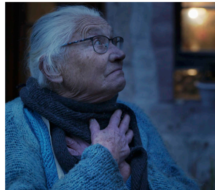
Ana Films et Les Films de la pluie - Suzanne Jour après jour - 2023

Zoom Bretagne - Cinéphare Fannie Campagna - coordinatrice T : 09 83 06 49 93 P : 06 98 89 60 97 bretagne.cinephare@gmail.com http://cinephare.com/bretagne